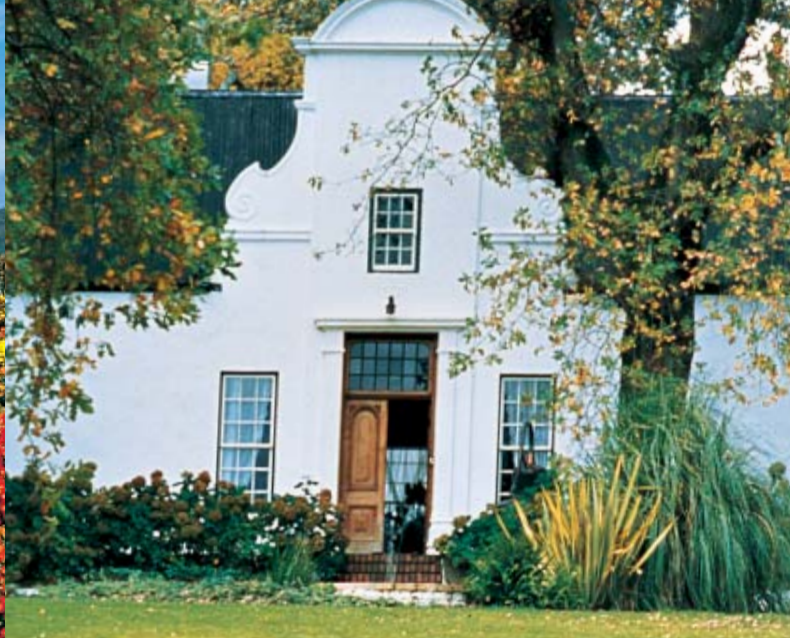
Alle Bilder dieses Folders sind urheberrechtlich geschützt.