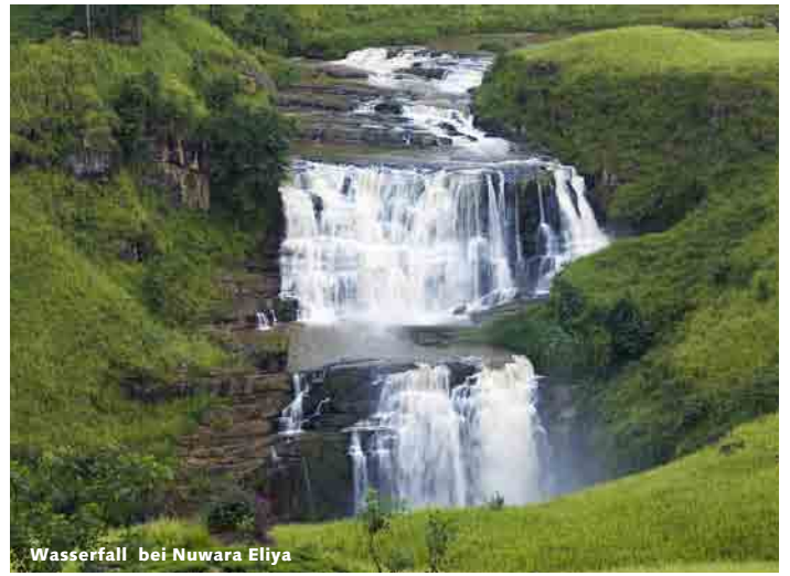
Wasserfall bei Nuwara Eliya

aus Feuchtsavanne, aber auch Dschungel, Strände, Frischwasser-Seen, Flüsse und Buschland sind hier zu finden. Seine beeindruckende Gesamtfläche von 1.572 km 2 wird von Elefanten, Wasserbüffeln, Affen, Leoparden, etlichen Hirscharten sowie weiteren exotischen Tierarten bevölkert. Zwei Zahlen verdeutlichen die atemberaubende Vielfalt von Yala: Im Park leben 32 Säugetierarten sowie 142 Vogelarten, von denen fünf endemisch sind, was bedeutet, dass sie ausschließlich im Yala Nationalpark zu finden sind. Sie übernachteten heute in Thissamaharama.