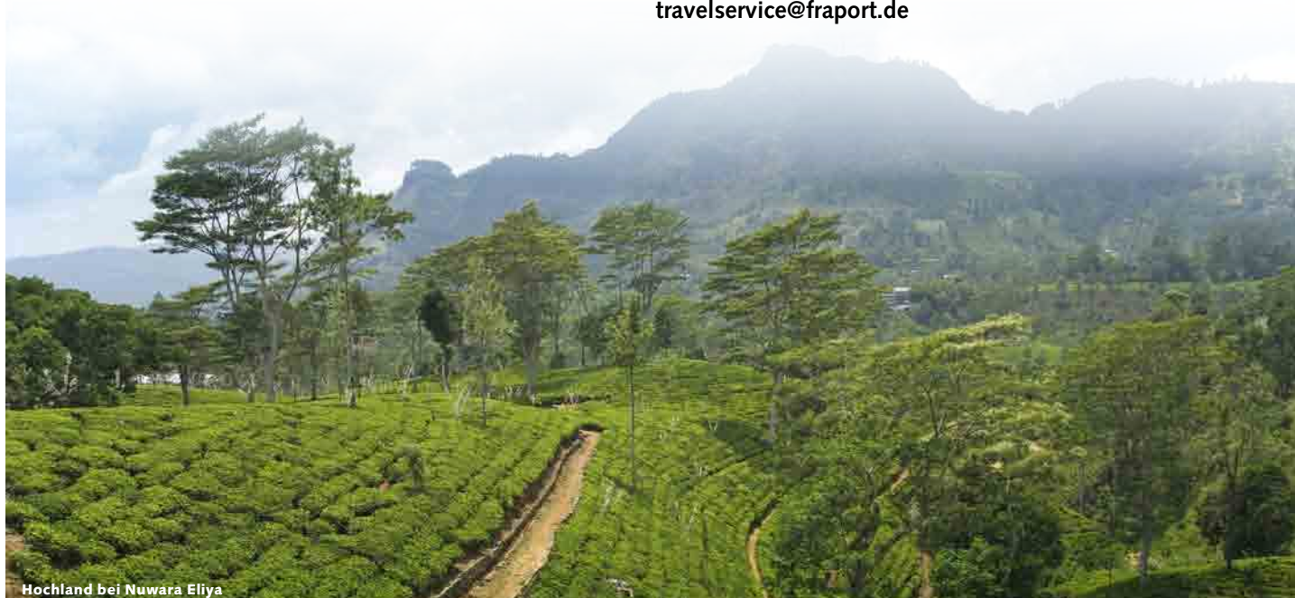
Hochland bei Nuwara Eliya